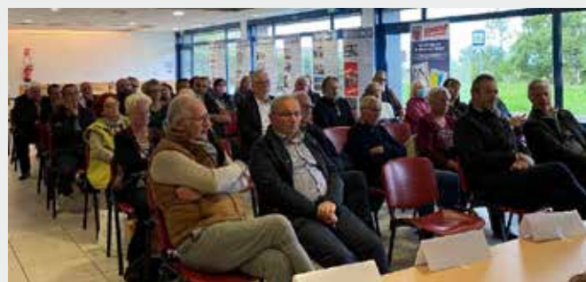
Une cinquantaine d'invités : élus, représentants des associations patriotiques, descendants de déportés et amis étaient présents.