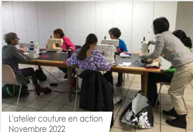
L'atelier couture en action Novembre 2022