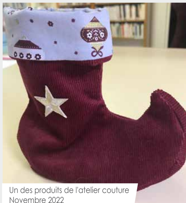
Un des produits de l'atelier couture Novembre 2022