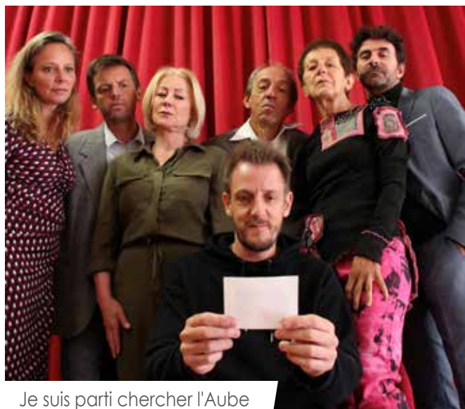
Je suis parti chercher l'Aube