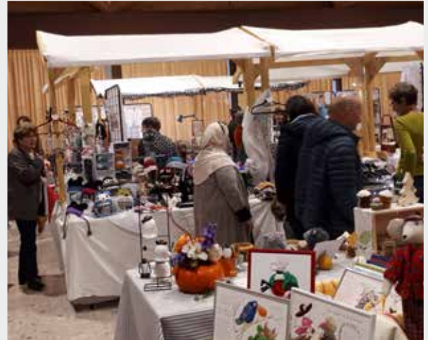
Exposition artisanale d'automne

Secrétariat ouvert tous les mardis matin (hors vacances scolaires) de 9 h à 12 h, salle de réunion de la mairie d'Armoiy, 06 51 13 72 36 ou foyer.armoy.leylaud@gmail.com