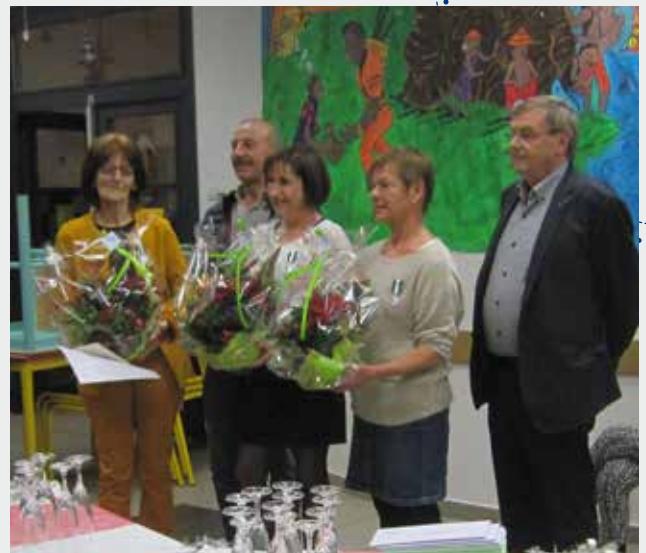
Remise de médailles du travail à l'occasion du pot de fin décembre