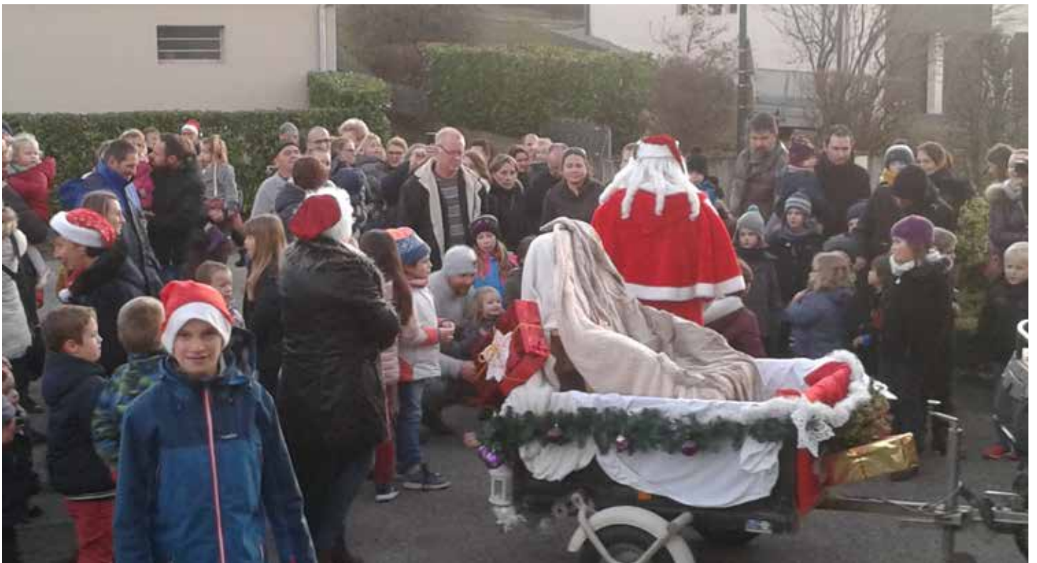
Noël des enfants