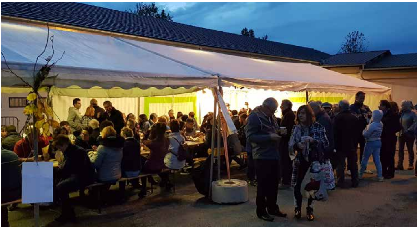
Fête de la châtaigne