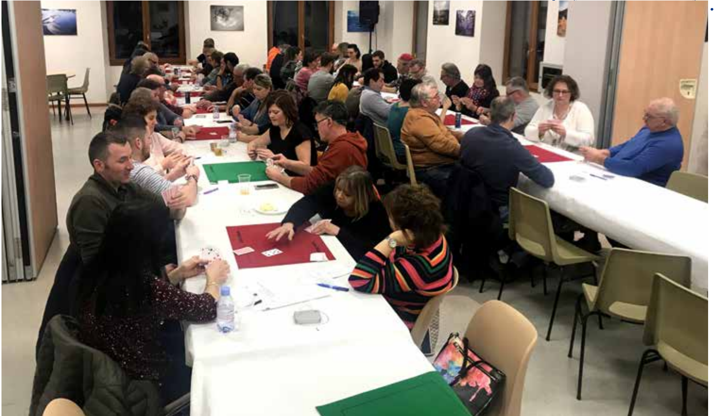
Belote de l'APE