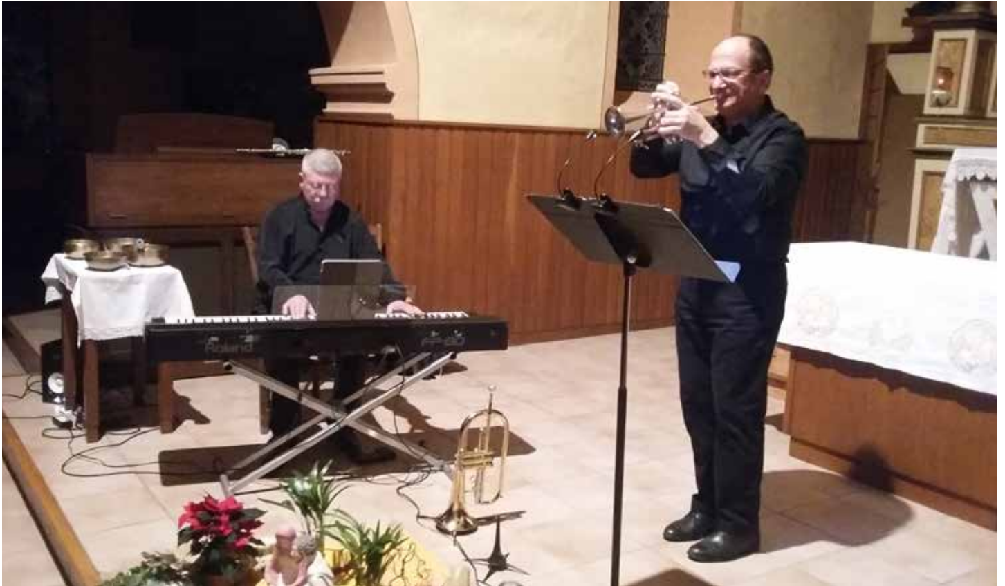
Concert de l'an nouveau