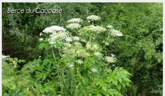
Berce du Caucase

La fauche répétée sur plusieurs années permet d'affaiblir la plante. La fauche doit être répétée avec une fréquence de 6 à 10 passages par an en période de végétation. Une fauche occasionnelle est à proscrire car elle ne fait que stimuler la plante. Les résidus de fauches doivent être exportés sur une plateforme isolée du sol et laissés à sécher à l'abri du vent et de l'eau (pas de compostage). Il ne faut jamais réutiliser ou déplacer les terres situées à proximité du massif de Renouée du Japon.