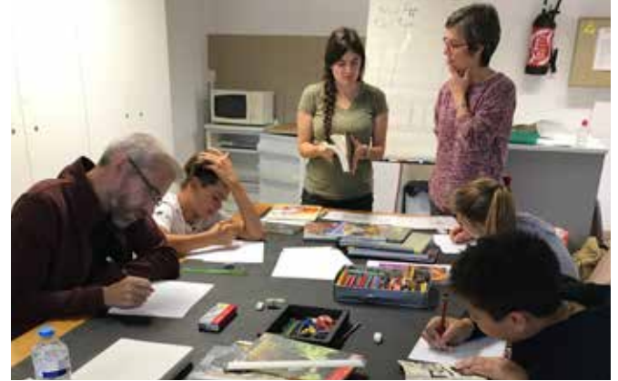
De grande qualité, il a rencontré un grand succès.