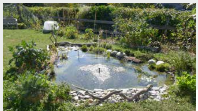
Mare dans un jardin d'Armoyle