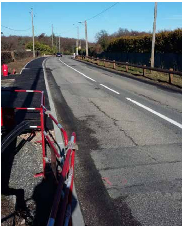
Trottoir et barrière de sécurité RD 26