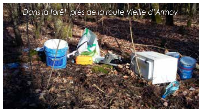
Dans la forêt, près de la route Vieille d'Armo