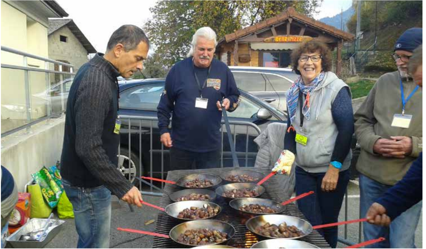
Fête de la châtaigne