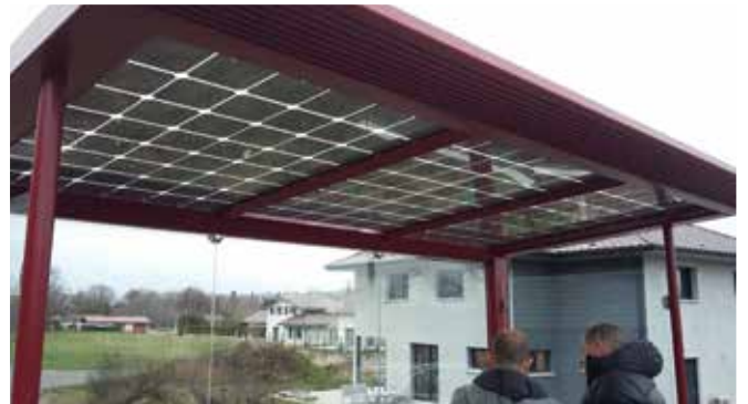
Abribus solaire, carrefour des Prés Carrés. Alimenté par des panneaux solaires sur le toit, il comporte aussi une prise pour recharger un téléphone portable !