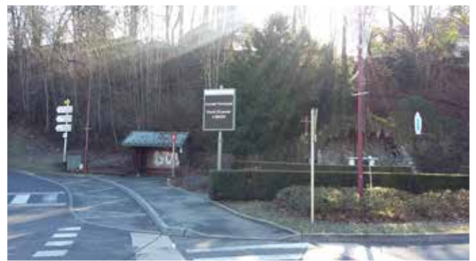
Installation d'un panneau d'information lumineux, virage de la grotte