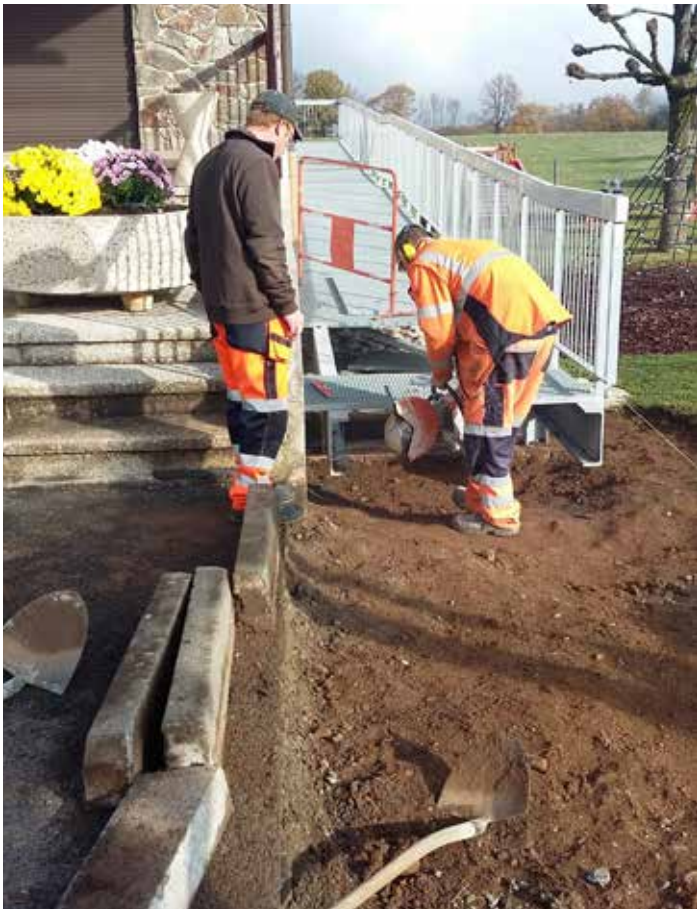
Finalisation de la rampe d'accès à salle polyvalente