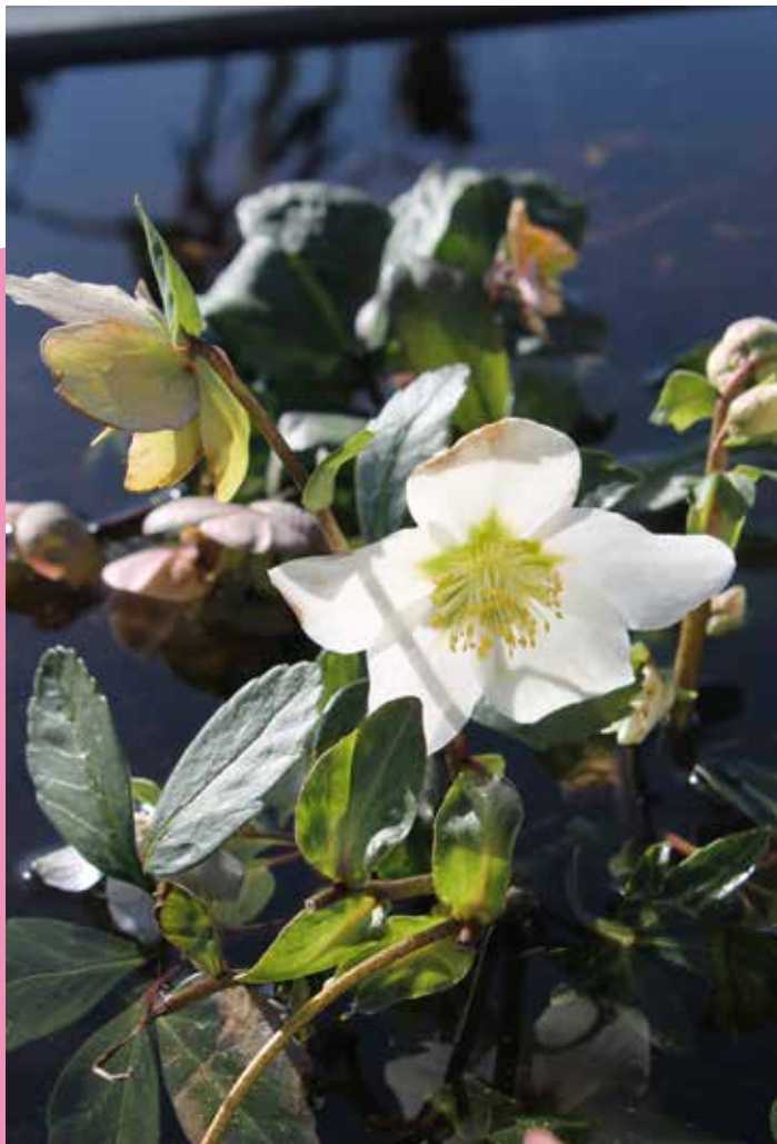
◀ Hellébore (ou rose de Noël)