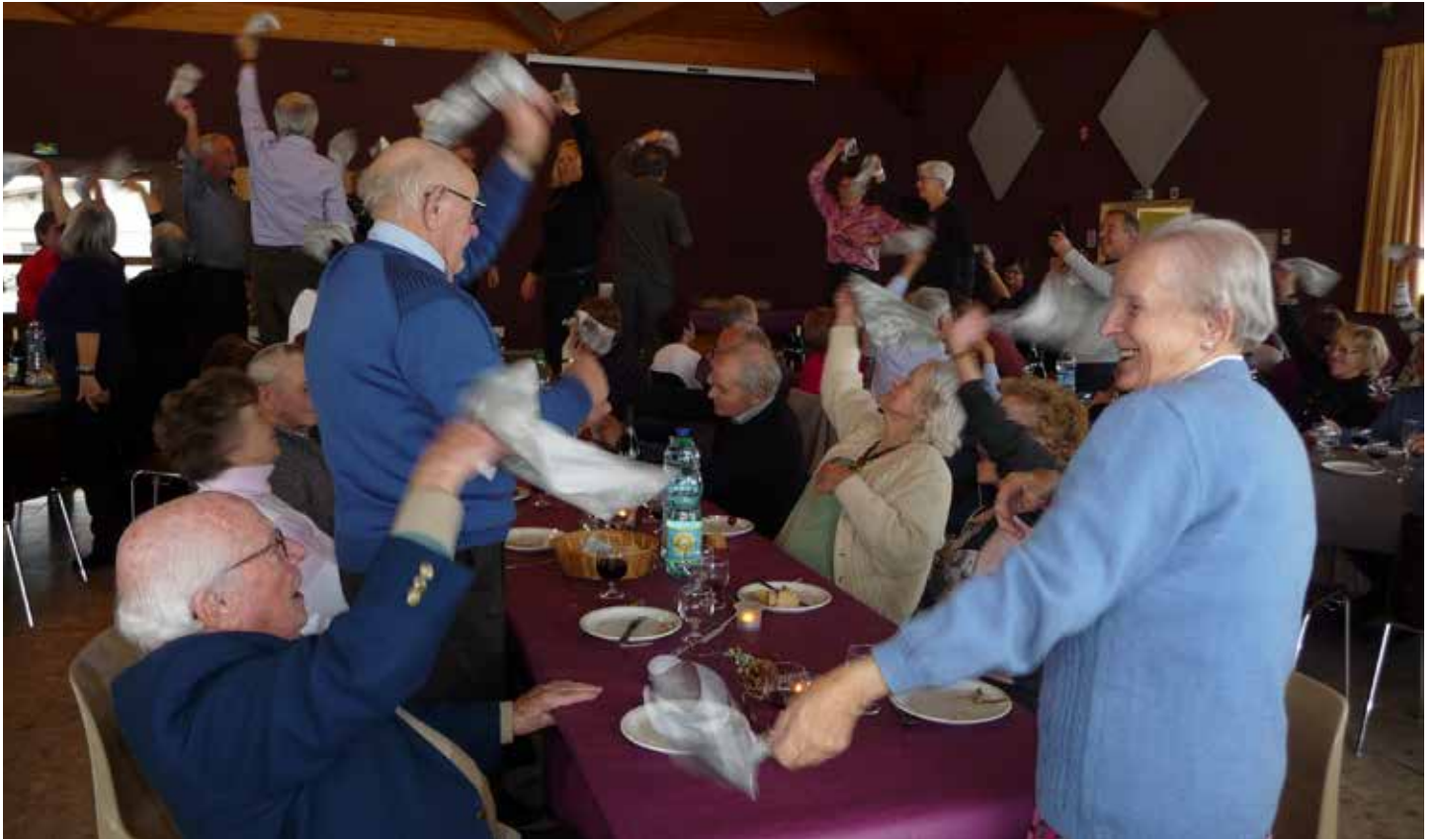
Repas des Anciens