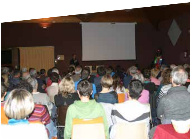
Animation du 25 novembre.

Projection le 25 novembre de "On va marcher sur l'Everest" dans le cadre du mois du film documentaire et avec le concours de Savoie biblio.