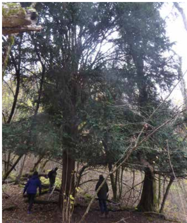
Un if très ancien

Cette forêt est composée d'espèces très variées, le hêtre (28 %), le frêne et autres feuillus (20 %), l'épicéa (20 %) et le châtaignier (17 %) sont majoritaires, mais on y trouve aussi des érables, des chênes, des merisiers et des ifs tricentenaires.