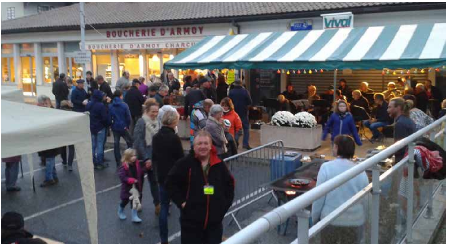
Fête de la Châtaigne