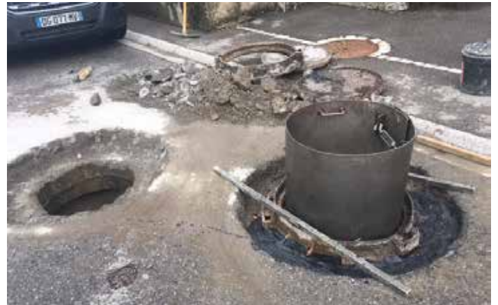
Remise à niveau des tampons de regard des eaux pluviales au centre du village.