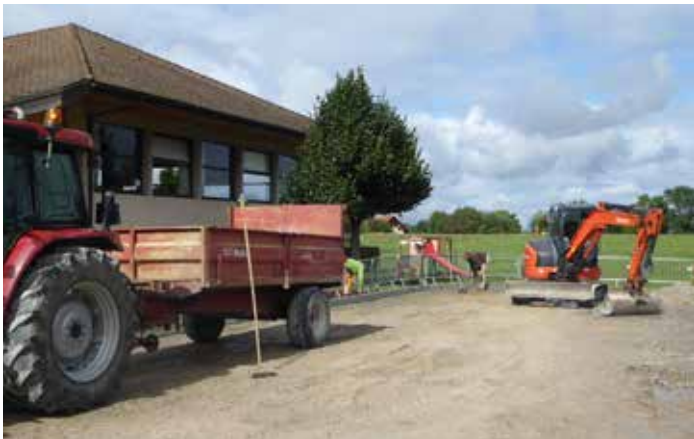
Aménagement du parking près de l'aire de jeux.