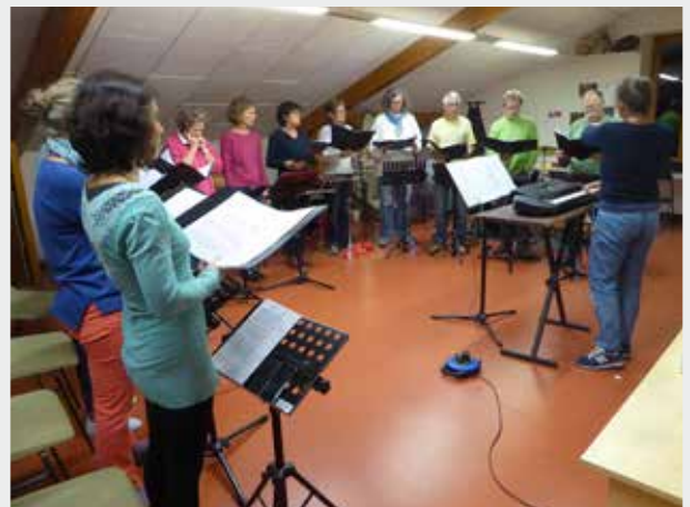
Atelier chant adultes

Il reste de la place dans plusieurs activités, n'hésitez pas à contacter le secrétariat du foyer : tous les mardis matin, de 9 h à 12 h, salle de réunions de la mairie d'Armoy, ou 06 51 13 72 36, ou foyer.armoy.lelyaud@gmail.com