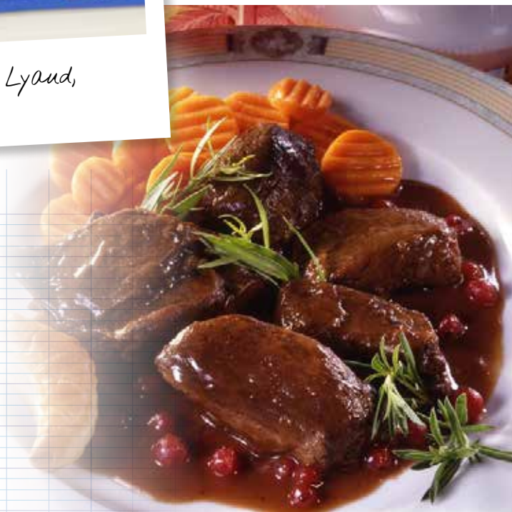
Selle de chevreuil rôtie au four sauce Grand Veneur

Si vous préférez, vous pouvez passer la préparation au chinois après avoir préalablement retiré les légumes afin d'obtenir une sauce lisse.