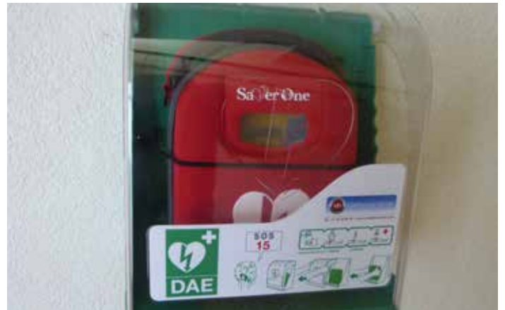
Installation d'un défibrillateur salle des fêtes.