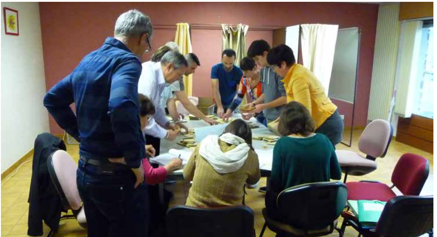
Dépouillement des élections (4 scrutins en 2 mois)