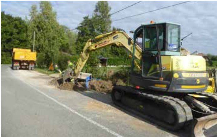
Remplacement d'une canalisation d'eau potable, route de l'Ermitage.