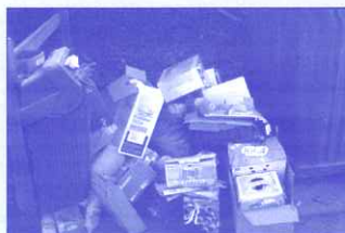
Point propre du chef-lieu le 01/01/08

MERCI DE NE PAS ABANDONNER, A CÔTÉ DES CONTENEURS, LES EMBALLAGES NON ADMIS PAR LE TRI SELECTIF !!!