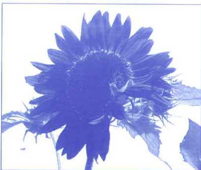
Affiche des vainqueurs du concours