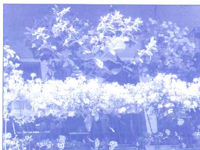
Maisons fleuries : vainqueur

Monsieur le Maire a eu le plaisir de remettre leur récompense aux vainqueurs à l'occasion d'une cérémonie qui a eu lieu le 19 octobre 2007 à la salle des fêtes.