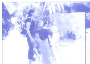
Zoo de Servion (Suisse)

L'APE remercie tous les participants, organisateurs et spectateurs, à leurs manifestations. En effet grâce à tous, les enfants ont pu faire de nombreuses activités. Alors bonnes vacances à tous et rendez-vous à la rentrée !!!