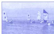
Stage de voile