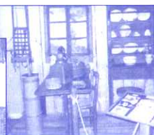
Musée des vieux métiers