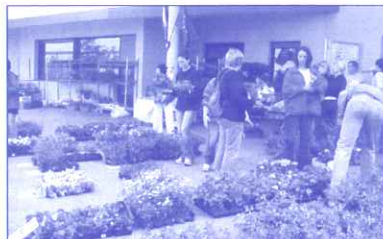
Vente de fleurs