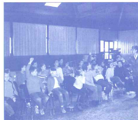
Rencontre des élèves de CE2 au CM2 avec le patrimoine local