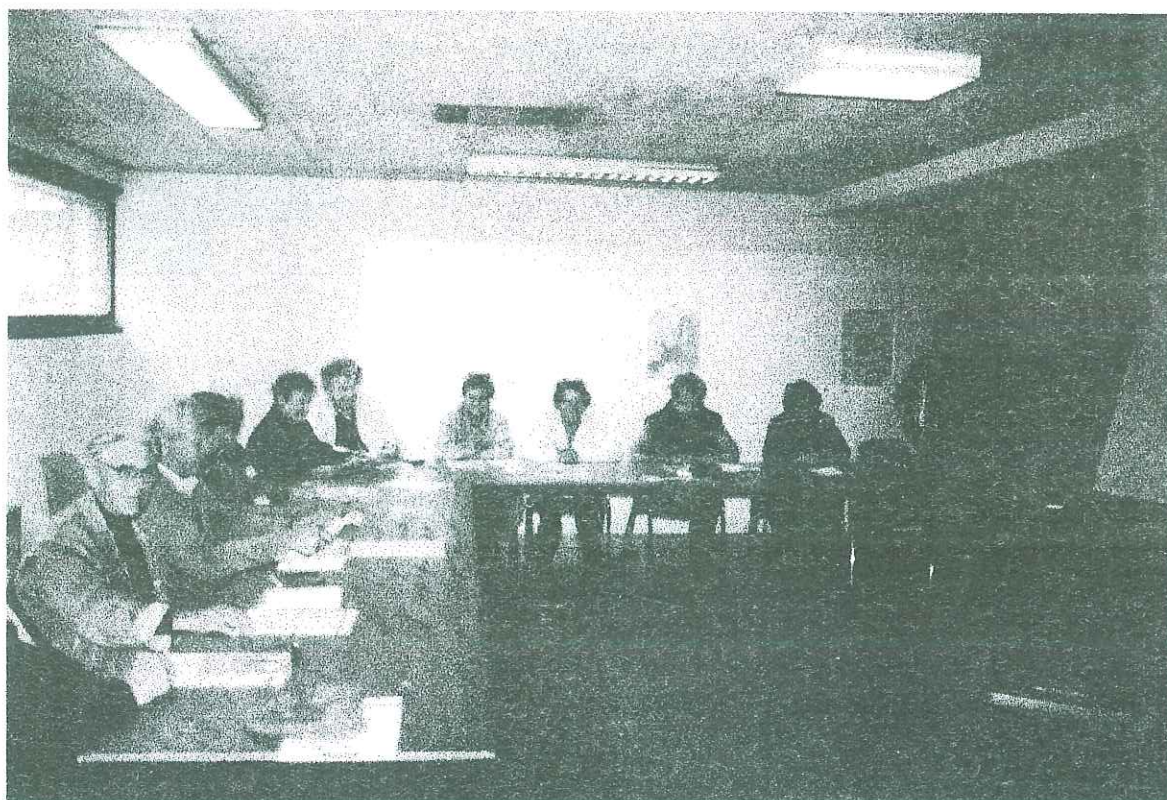
▲ Séance d'information sur l'euro.

Un vin d'honneur offert par la municipalité clôturera la soirée.